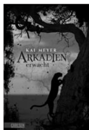
Arkadien erwacht ISBN 978-3-551-58201-0 € 19,90 (D) / € 20,50 (A) / sFr. 35,90