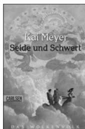
Seide und Schwert ISBN 978-3-551-35913-1 € 9,95 (D) / € 10,30 (A) / sFr. 18,90

Wirklich absolut schön, traumhaft, mitreißend und spannend geschrieben, freue mich jetzt schon auf den 2.